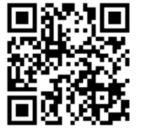
비폭력 지지서명 바로가기

사이버폭력으로부터 도움을 요청한 아이들을 위해 비폭력 지지서명에 함께 참여해주세요! 보이지 않는 폭력, 사이버 지옥에서 우리 아이들을 꺼내주세요.